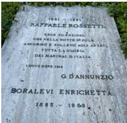
Cimitero di San Biagio di Zoagli (GE) Tomba di Raffaele Rossetti Con epitaffio di G. D'Annunzio