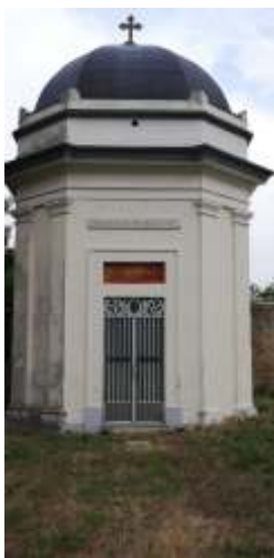
Cimitero di Orsogna (CH) Cappella di Raffaele Paolucci di Valmaggione.