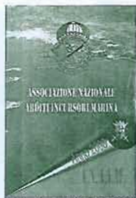
Calendario A.N.A.I.M. 2008

Puoi prenotarlo e ritirarlo in occasione del raduno Nazionale, oppure puoi (per chi è