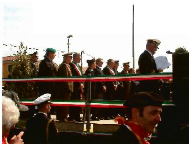
Alcuni momenti della manifestazione